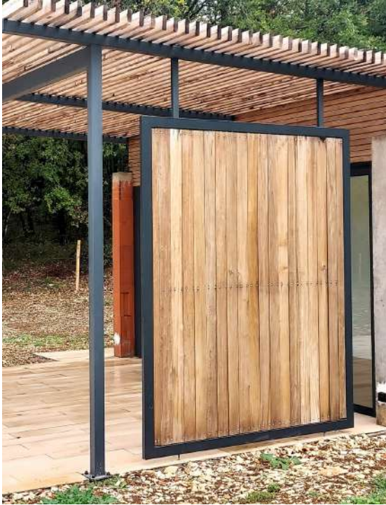
Vue extérieures : lames fermés

Modèle présenté en essence peuplier T.H.T. avec lames verticales