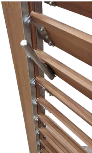
Système orientable en inox: sur lames horizontales, semi ouvertes