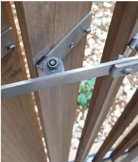
Système orientable en inox: sur lames verticales